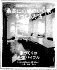
世界一わかりやすい「最高に心地のいい家」をつくる方法 主婦の友社/編