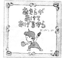
あきらがあげてあげるから ヨシタケシンスケ