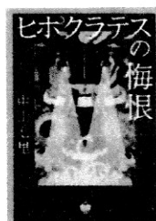
ヒポクラテスの悔恨 中山七里