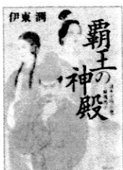
覇王の神殿 伊東潤