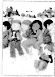
Story for you 講談社/編