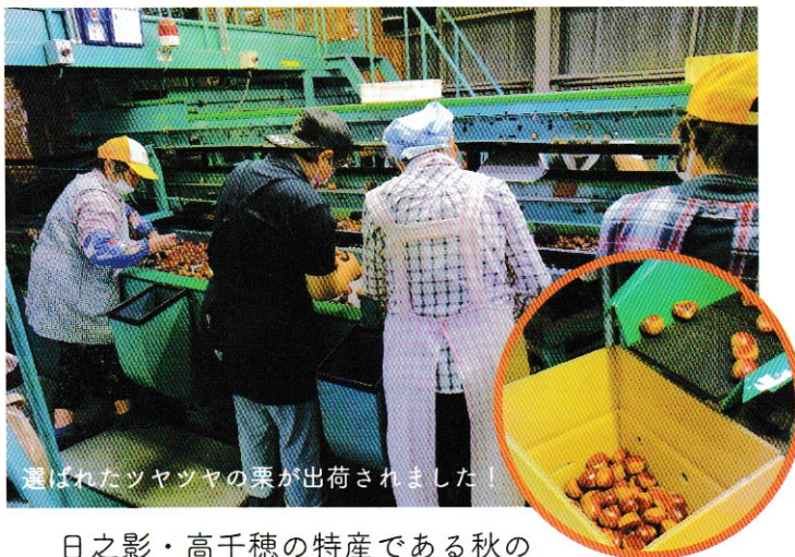
選ばれたツツヤの栗が出荷されました！