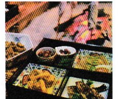
(左) 元牛小屋の離れ (中) ロフトもある客室 (右) 囲炉裏で焼いた川魚と季節の料理