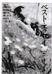
ベスト・エッセイ 2021 日本文藝家協会/編