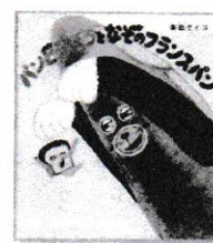
パンどろぼうとなぞのフランスパン 柴田ケイコ